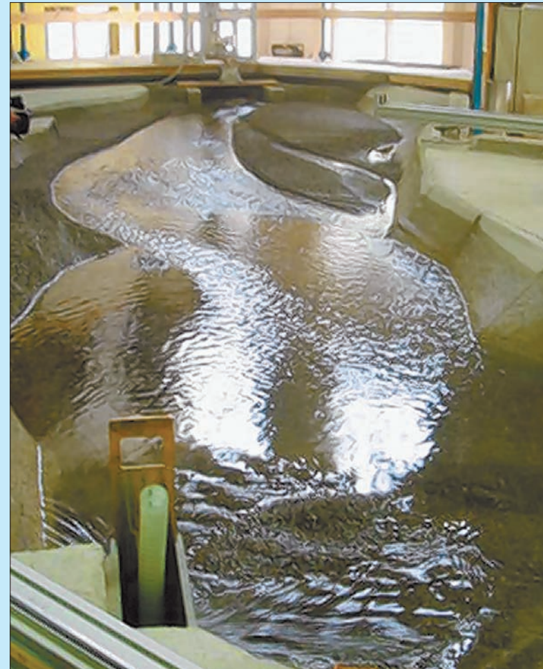
Durch den Bau eines Umleitstollens könnte das Geschiebe grosszügig um den Stausee herumgeführt werden und unter der Staumauer wieder in die Albula geleitet werden.

rung des Stausees ausgelöst werden könnten. Wichtig dabei sei vor allem, dass der Wasserspiegel des Stausees langsam abgesenkt wird, damit keine Organismen trocken fallen. Bei entsprechendem ökologischen Monitoring und Auflagen sei aber grundsätzlich mit geringen Auswirkungen zu rechnen, so Elber.