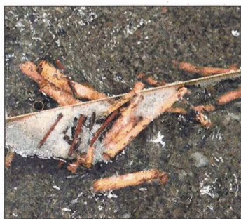
Das Leitsystem trennte Holzstämmen im Miniaturformat.

waltige Mengen Schiwwemmholz im Bereich Kraftwerk und liessen die Aare über das Ufer treten.